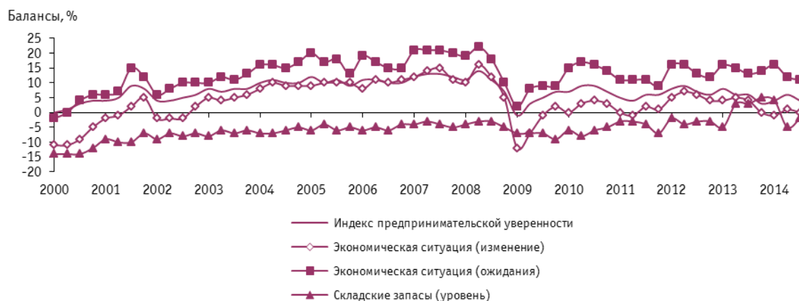
Рис. 1. Динамика индекса предпринимательской уверенности и его составляющих в организациях розничной торговли

В шести федеральных округах Российской Федерации 5 наибольшее значение индекса предпринимательской уверенности зафиксировано в организациях розничной торговли Приволжского и Дальневосточного федеральных округов (+7 и +8% соответственно), наименьшее – Северо-Западного федерального округа (+3%).