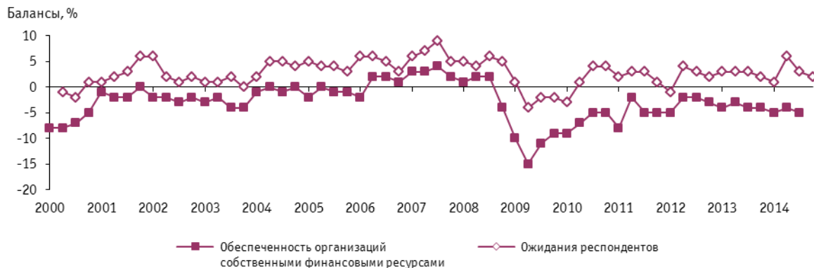
Рис. 9. Динамика оценок изменения обеспеченности собственными финансовыми ресурсами в организациях розничной торговли

Негативный отзыв сложившейся конъюнктуры в отрасли также получил показатель обеспеченность фирм собственными средствами . Баланс оценки изменения полученного значения претерпел дальнейшую негативную корректировку и в анализируемом периоде составил -5% (-4% в III квартале 2013 г.).