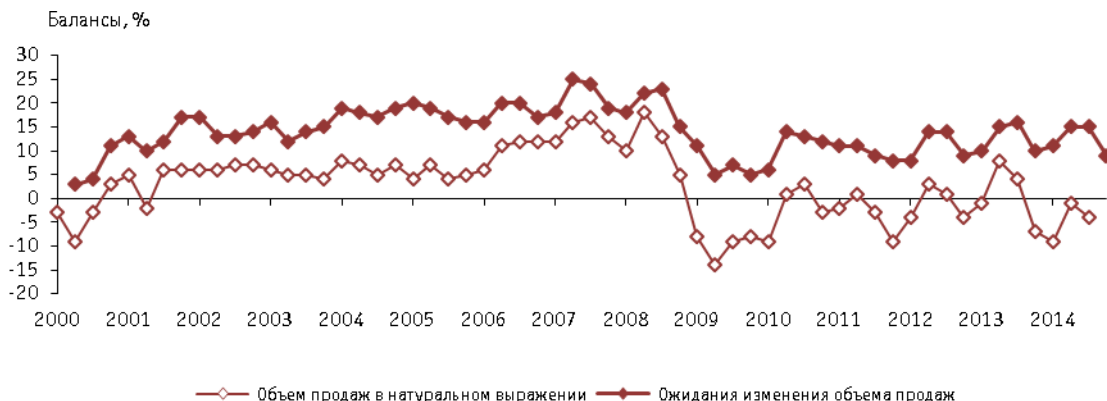
Рис. 3. Динамика оценок изменения объемов продаж в организациях розничной торговли

Учитывая зафиксированные результаты, весомым неблагоприятным моментом выступают и сниженные оценки руководителей относительно перспективы изменения динамики заказов и продаж.