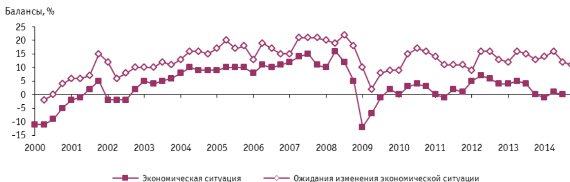
Рис. 10. Динамика оценок экономической ситуации в организациях розничной торговли

В результате возникшей макроэкономической неопределенности и эскалации негативных рыночных тенденций, балансовое значение оценки изменения экономической ситуации снизилось относительно II квартала на 1 п.п. и составило 0% (+4% в III квартале 2013 г.).