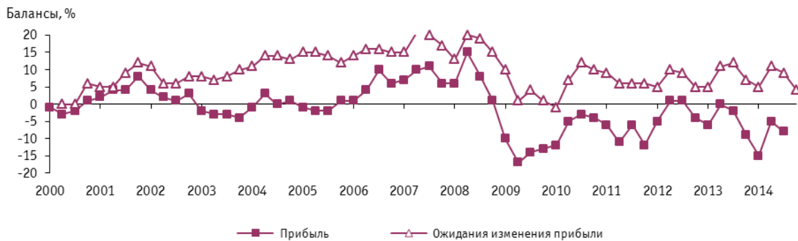
Рис. 8. Динамика оценки изменения прибыли в организациях розничной торговли

Негативный отзыв сложившейся конъюнктуры в отрасли также получил показатель обеспеченность фирм собственными средствами . Баланс оценки изменения полученного значения претерпел дальнейшую негативную корректировку и в анализируемом периоде составил -5% (-4% в III квартале 2013 г.).