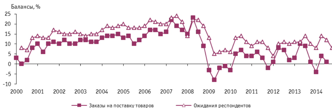
Рис. 2. Динамика оценок изменения количества заказов на поставку товаров в организациях розничной торговли

Сложившаяся покупательская модель — следствие продолжающегося сжатия реальных располагаемых доходов населения, темп роста которых в январе - августе составил лишь 100,7%, удорожания кредитных предложений, ослабление национальной валюты.