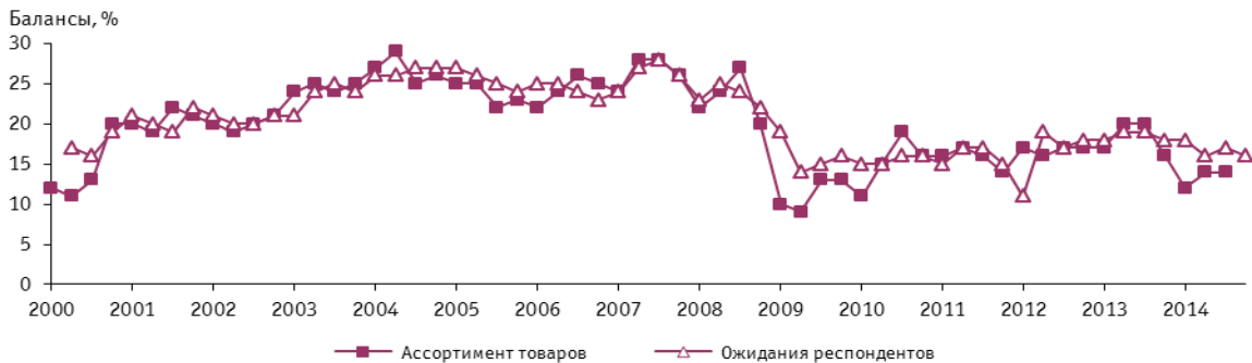
Рис. 5. Динамика оценок изменения ассортимента товаров в организациях розничной торговли

Вывод из розничного оборота импортной доли продовольственной продукции внесет свои коррективы в ассортиментную политику фирм уже в IV квартале, что выразится в дальнейшем замедлении темпов расширения ассортимента.