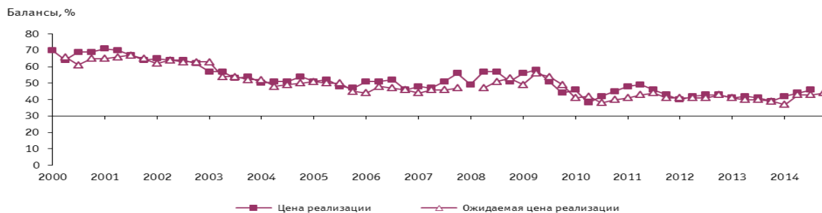
Рис. 6. Динамика оценок изменения цен реализации в организациях розничной торговли

Исходя из результатов обследования, средний сложившийся уровень торговой наценки в организациях относительно II квартала не изменился и составил 27%, при этом, по мнению участников опроса, желаемая средняя торговая наценка, которая была бы достаточной для возмещения издержек обращения и обеспечила получение необходимой прибыли, составляет около 40%.