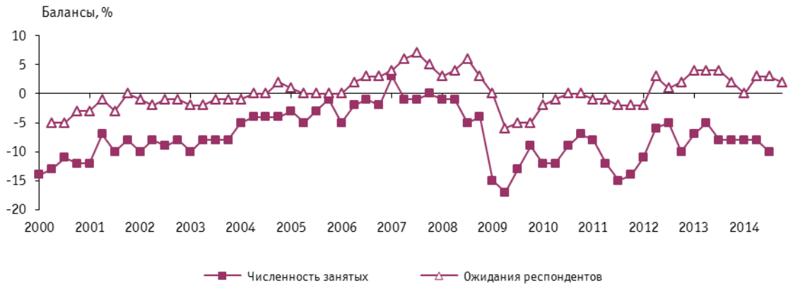
Рис. 4. Динамика оценок изменения численности занятых в организациях розничной торговли

Динамика торгового процесса сопровождалась усилением сокращения занятых в отрасли. О выбытии персонала в своих организациях по сравнению со II кварталом сообщили более 25% предпринимателей. В разгар летне-осеннего сезона наблюдаемая тенденция указывает на максимальное расширение бюджетооптимизирующих мер в организациях. Согласно оценкам более 80% респондентов, ожидать изменений в их кадровой политике по итогам года не следует.